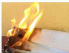
b) Kertas terbakar