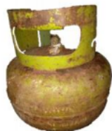
Gambar 1.1 a) Tabung gas yang berkarat