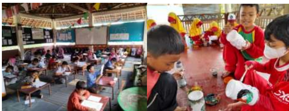
Gambar 2 : Proses Belajar Mengajar di SD Alam Lukulo Kebumen