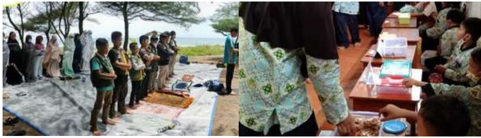
Gambar 3 : Program Unggulan SD Alam Lukulo mengadakan Backpacker dan Market Day .

Mengintegrasikan Pendidikan Agama Islam dengan mata pelajaran umum, memungkinkan peserta didik tidak hanya mempelajari pelajaran agama saja, melainkan dapat secara bersama mempelajari pelajaran umum (Khoiriyah et al., 2021). Penerapan pembelajaran Pendidikan Agama Islam di SD Alam Lukulo secara spesifik dilakukan dengan berupa kegiatan-kegiatan rutin seperti keagamaan dengan melakukan kegiatan sholat berjamaah, sholat dhuha, BTQ, kajian bunda, mabit, jumat bersih dengan tujuan untuk membentuk akhlakul karimah yang berjiwa pemimpin dan cinta terhadap lingkungan. Pendidikan Agama Islam juga mengajarkan untuk mempunyai sikap tanggungjawab, bekerja sama, kreatif dengan melakukan kegiatan berkebun dan fun cooking . Materi Pendidikan Agama Islam mengkolerasikan dengan pembentukan karakter dengan kegiatan market day , out tracking fun advantage , outing class , dan morning talk . Penanaman jiwa mandiri dan kewirusahaan dapat diintegrasikan dengan Pendidikan Agama Islam dengan melakukan kegiatan live in (bermukim dipedesaan)/melakukan wawancara dengan masyarakat setempat dan magang dengan ikut berinteraksi dengan pelaku bisnis. Hal tersebut menunjukkan bahwa integrasi Pendidikan Agama Islam dengan pengetahuan umum baik akademik maupun non akademik yang dapat mengaitkan empat pilar atau fokus kurikulum sekolah alam yaitu akhlakul karimah, berpengetahuan, jiwa pemimpin, dan pembisnis.