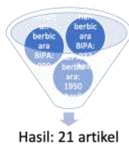
Gambar 1. Jumlah Artikel Terpilih

Berdasarkan metode atau prosedur pada subbab sebelumnya, ditemukan sejumlah 933 artikel dengan kata kunci kesalahan berbicara BIPA, 999 hasil dengan pencarian kesulitan berbicara BIPA, dan sejumlah 1950 hasil dengan pencarian BIPA berbicara. Hasil dari pencarian diilustrasikan sebagai berikut.